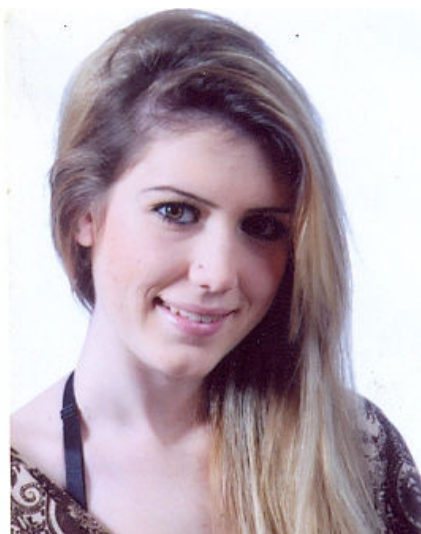
Σελίδου Ελίζα του Βασίλειου Τεχνολογίας Τροφίμων Τ.Ε.Ι. Θεσσαλονίκης