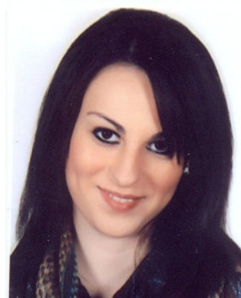
Θεοδοσίου Βασιλική του Γεώργιου Χημείας Ιωαννίνων