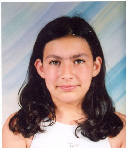
Παρασκευαδέλη Βασιλική του Αριστείδη Λογιστικής Τ.Ε.Ι. Ηπείρου (Πρέβεζα)