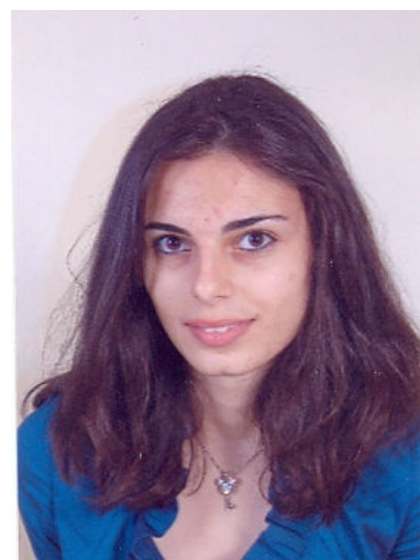
Τοπούζη Ταμάρα του Χριστόφορου Επιστήμης Τροφίμων και Διατροφής Αιγαίου (Λήμνος)