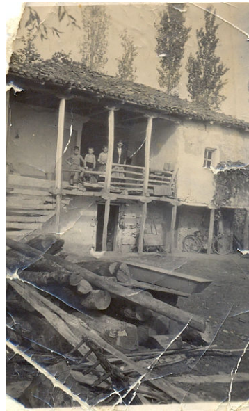
Το σπίτι που επιτάχθηκε

ΑΠΑΝΤΗΣΗ: Με λένε Θεοδοσίου Νεόφυτο και είμαι 77 ετών.